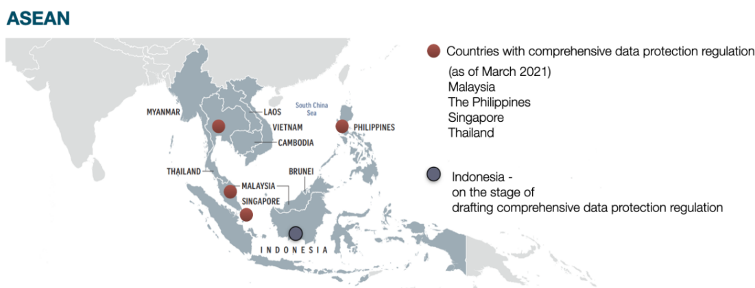
Imagem 1: Status das legislações em proteção de dados pessoais nos diversos países-membros da ASEAN 31

A imagem demonstra a situação, em março de 2021, das leis em proteção de dados na ASEAN: